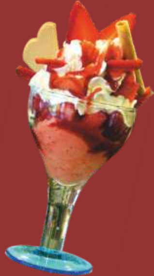
Erdbeer Becher € 9,00

Kiwi und Vanilleeis, Kiwischeiben mit Sahne & Kiwisauce