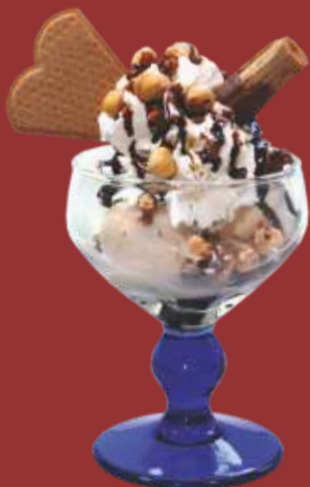
Nuss Becher € 9,00

Gemischtes Nusseis, Sahne, Hasel- und Walnüsse, Schokosauce