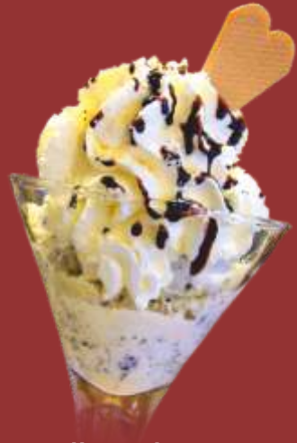
Stracciatella Becher € 8,50

Amarena- & Vanilleeis mit Amarena-Kirschen, Sahne & Amarensauce 1)