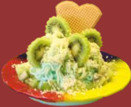
Kiwi Spaghetti-Eis € 9,00

Sahne, Kiwi- und Vanilleeis mit Kiwisaucе und Kiwistückchen