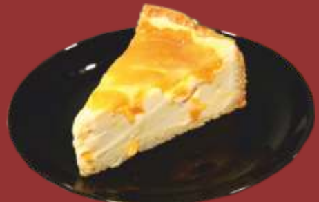
Schmand-Mandarine € 4,50