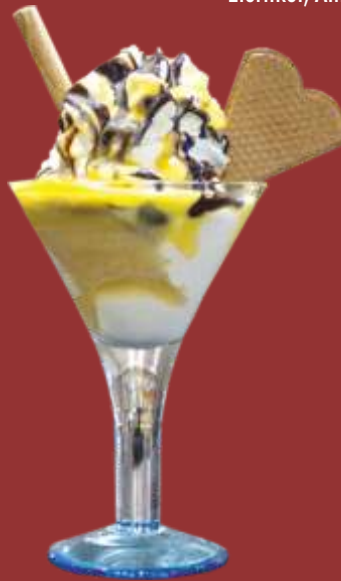
Schweden Becher € 9,50

Vanille- und Nusseis in weißer Schokolade, Eierликör, Amarenakirschen & Sahne *