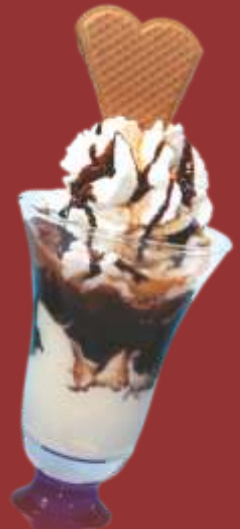
Baileys Traum € 9,50

Schokoladen und Vanilleeis mit eingelegten Brand-Kirschen, Sahne und Schokoladensauce *