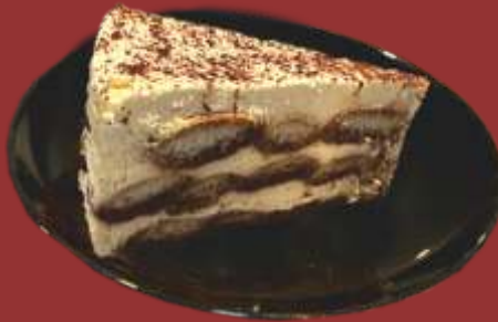
Tiramisu € 5,50