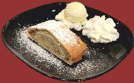
Apfelstrudel € 7,50