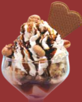
Knusper Becher € 9,00

Stracciatellaeis mit frischer Sahne, weiße Schokoladenraspel & Schokoladensauce