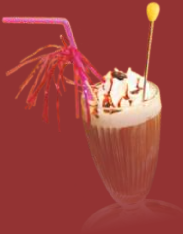
Eiskaffee € 5,00 Vanilleeis, Kaffee, Sahne und Moccasauce 2)