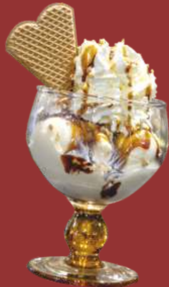
Krokant Becher € 8,50

Gemischtes Nusseis, Sahne, Krokant, Amarettiniekexse & Schokoladensauce