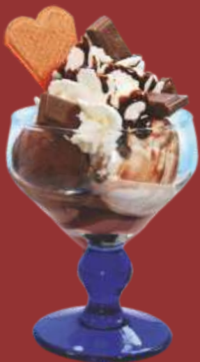
Schoko Becher € 8,50

Gemischtes Eis mit frischen Früchten, Sahne und Amarenasauce 1)