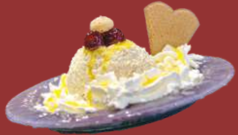
Tartufo weiß € 9,50

Große Kugel Schokoladeneis, gefüllt mit Kaffeeликör, Sahne, Amarenakirschen und Schokostreusel * 1)