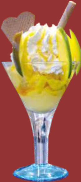
Mango Becher € 9,00

Erdbeer und Vanilleeis, frische Erdbeeren, Sahne und Erdbeersauce