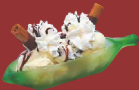
Banana Split € 8,50

Schokoladeneis, Sahne, Schokostückchen und Schokoladensauce