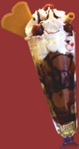
Schwarzwald Becher € 9,50

Vanilleeis, Apfelmus, Schokosauce, Eierликör und Sahne *