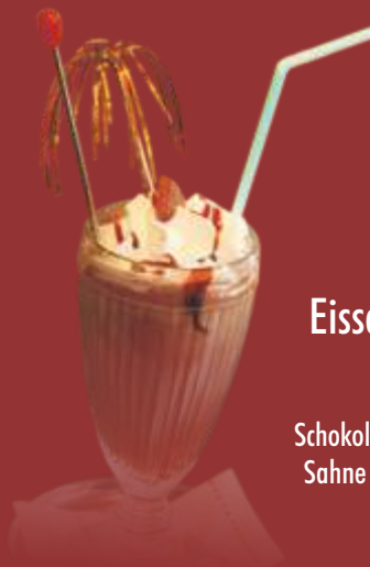
Eisschokolade € 5,00 Schokoladeneis, Kakao, Sahne & Schokosauce