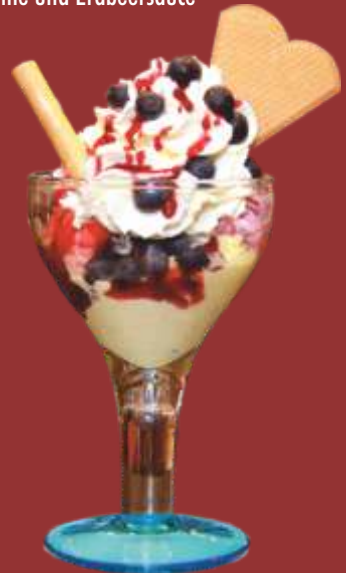
Heidelbeer Becher € 9,00

Mango- und Kokoseis, frische Mango, Sahne und Mangosauce