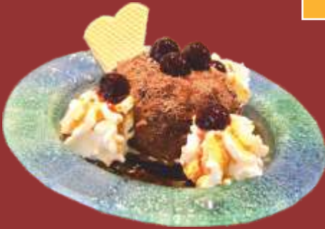
Tartufo € 9,50

Große Kugel Schokoladeneis, gefüllt mit Kaffeeликör, Sahne, Amarenakirschen und Schokostreusel * 1)