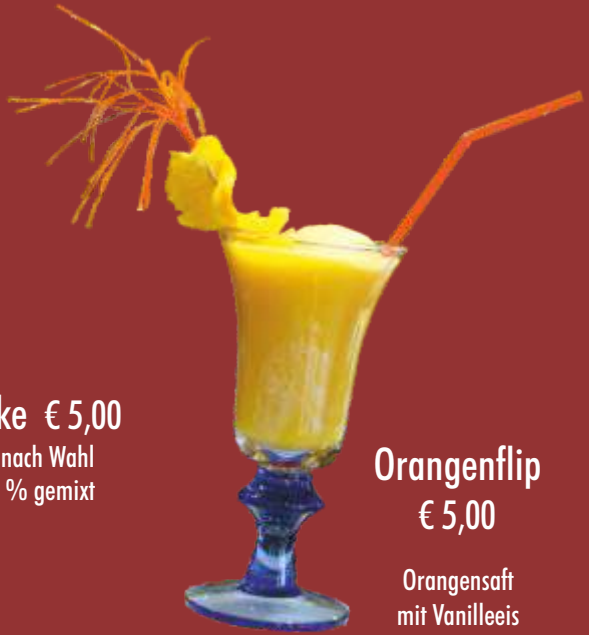
Orangenflip € 5,00 Orangensaft mit Vanilleeis