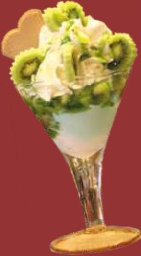
Kiwi Becher € 9,00

Kiwi und Vanilleeis, Kiwischeiben mit Sahne & Kiwisauce