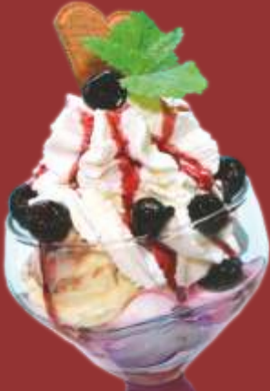
Amarena Becher € 9,00

Amarena- & Vanilleeis mit Amarena-Kirschen, Sahne & Amarensauce 1)