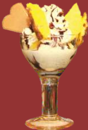
Piña Colada Becher

Eierlikör- & Schokoladen- eis, Eierlikör mit Sahne und Schokosauce *