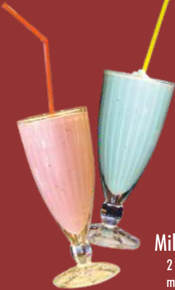
Milch Shake € 5,00 2 Kugeln Eis nach Wahl mit Milch 3,5 % gemixt