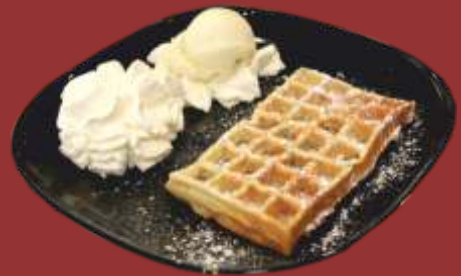
Belgische Waffel € 7,00