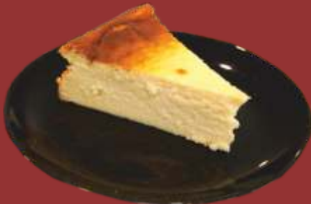
Käsekuchen € 4,00