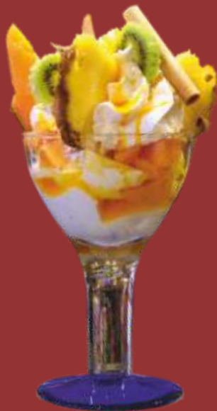
Früchte Becher € 10,00

Gemischtes Nusseis, Sahne, Hasel- und Walnüsse, Schokosauce