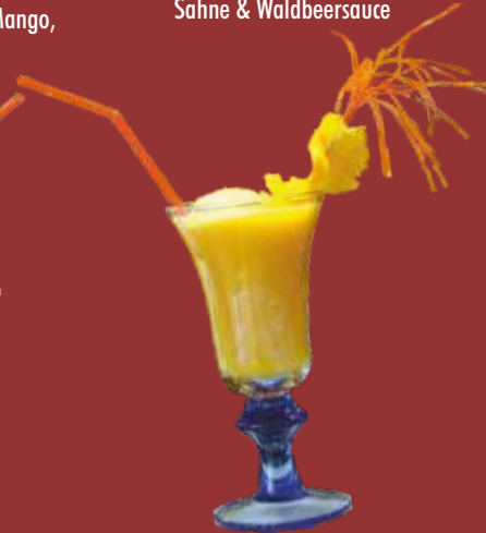
Orangenflip € 5,00 Orangensaft mit Vanilleeis