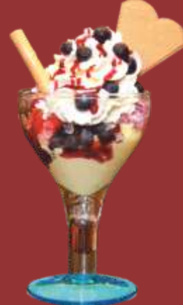
Heidelbeer Becher € 8,50 Heidelbeer- und Vanilleeis, Heidelbeeren, Sahne & Waldbeersauce