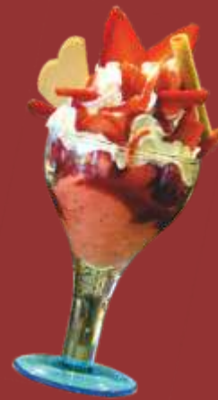
Erdbeer Becher € 8,50 Erdbeer und Vanilleeis, frische Erdbeeren, Sahne und Erdbeersauce