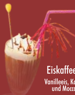
Eiskaffee € 5,00 Vanilleeis, Kaffee, Sahne und Moccasauce 2)