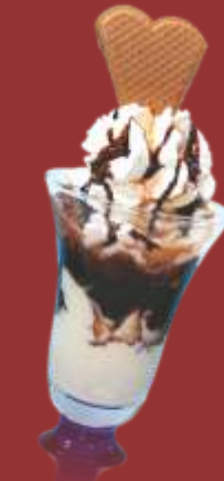
Baileys Traum € 8,50 Gemischtes Eis, Baileys, Schokosauce, Schokostücke und Sahne *