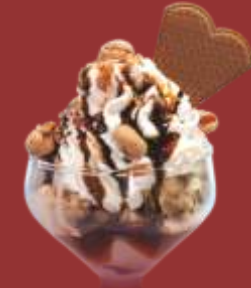
Knusper Becher € 7,50 Gemischtes Nusseis, Sahne, Krokant & Schokoladensauce