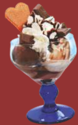
Schoko Becher € 7,00 Schokoladeneis, Sahne, Schokostückchen und Schokoladensauce