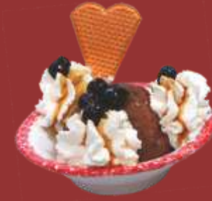
Tartuffo € 8,50 Große Kugel Schokoladeneis, gefüllt mit Kaffeelikör, Sahne, Amarenakirschen und Schokostreusel * 1)