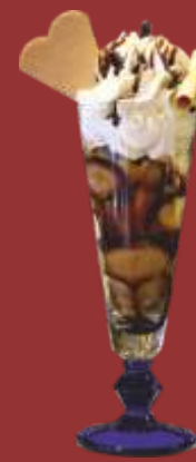
Mocca Becher € 8,50 Vanille- und Moccacis, Moccabohnen, Kaffeelikör, Kaffeesauce und Sahne *