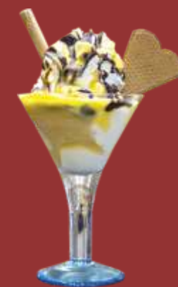
Schweden Becher € 8,50 Vanilleeis, Apfelmus, Schokosauce, Eierlikör und Sahne *