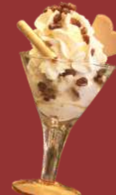
Malaga Becher € 8,50 Malagaeis mit Rumrosinen und Sahne *