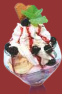
Amarena Becher € 7,50 Amarena- & Vanilleeis mit Amarena-Kirschen, Sahne & Amarensauce 1)