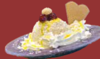
Tartuffo weiß € 8,50 Vanille- und Nusseis in weißer Schokolade, Eierlikör, Amarenakirschen & Sahne *