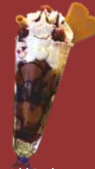
Schwarzwald Becher € 8,50 Schokoladen und Vanilleeis mit eingelegten Brand-Kirschen, Sahne und Schokoladensauce *