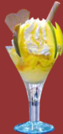
Mango Becher € 8,50 Mango- und Kokoseis, frische Mango, Sahne und Mangosauce