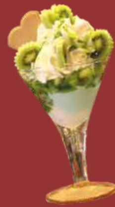
Kiwi Becher € 8,50 Kiwi und Vanilleeis, Kiwischeiben mit Sahne & Kiwisauce