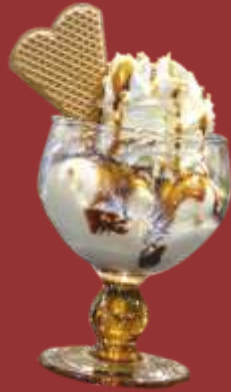
Krokant Becher € 7,00 Vanille-, Karamell- und Nusseis, Karamellsauce, Sahne und Krokant