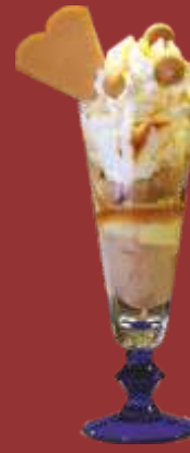
Amaretto Becher € 8,50 Vanille- & Amarettoeis, Amarettoликör, Sahne & Amarettinikese *