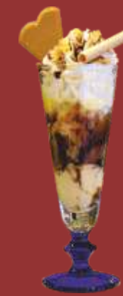
Eierlikör-becher € 8,50 Eierlikör- & Schokoladeneis, Eierlikör mit Sahne und Schokosauce *