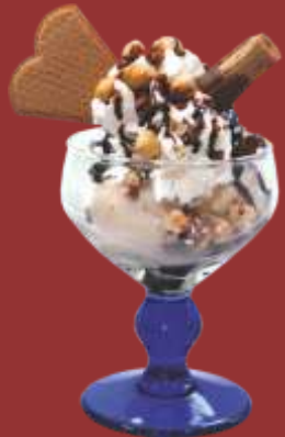
Nuss Becher € 7,50 Gemischtes Nusseis, Sahne, Hasel- und Walnüsse, Schokosauce