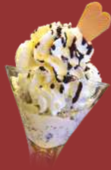
Stracciatella Becher € 7,50 Stracciatellaeis mit frischer Sahne, weiße Schokoladenraspel & Schokoladensauce