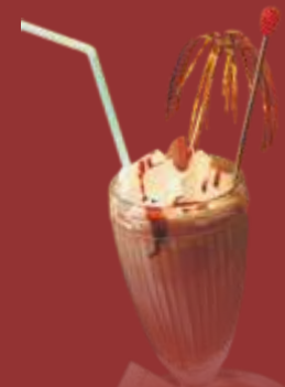
Eisschokolade € 5,00 Schokoladeneis, Kakao, Sahne & Schokosauce