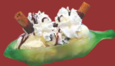
Banana Split € 7,00 Banane, Vanille und Schokoeis mit einer Banane, Sahne und Schokoladensauce